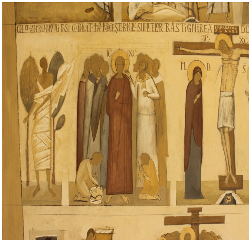
Proiect iconografic, arca noetica Alba Iulia, martie 2013