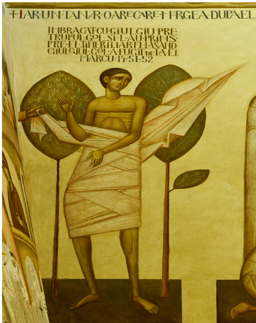
Tânărul gol, Arca noetica, Alba Iulia