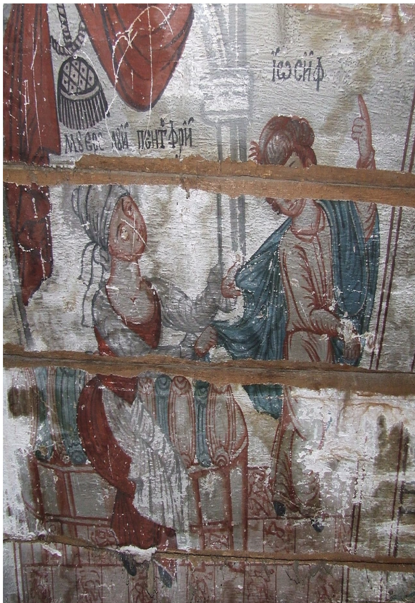
Pictură în podul bisericii Orșita, Sălaj