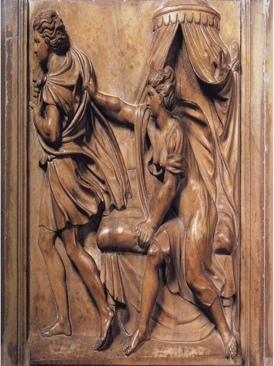
Properzia De Rossi Joseph and Potiphar's Wife.