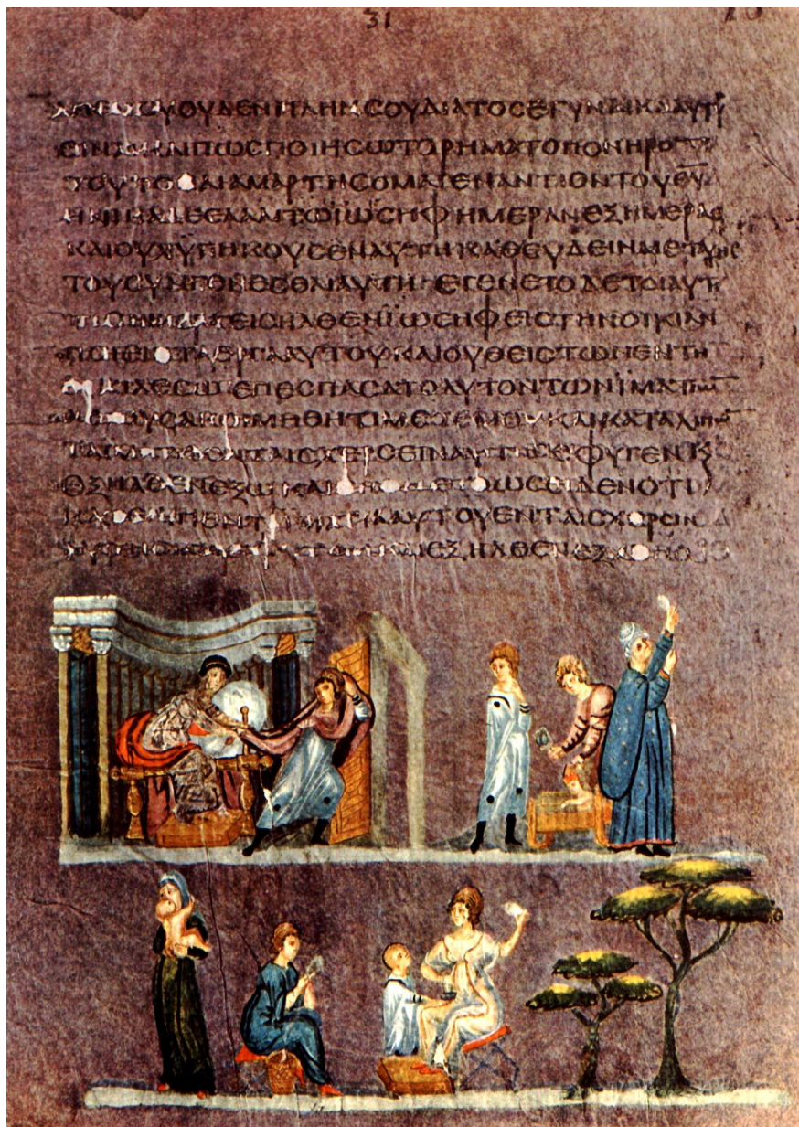
Tănărul gol Iosif, sf. sec. VI